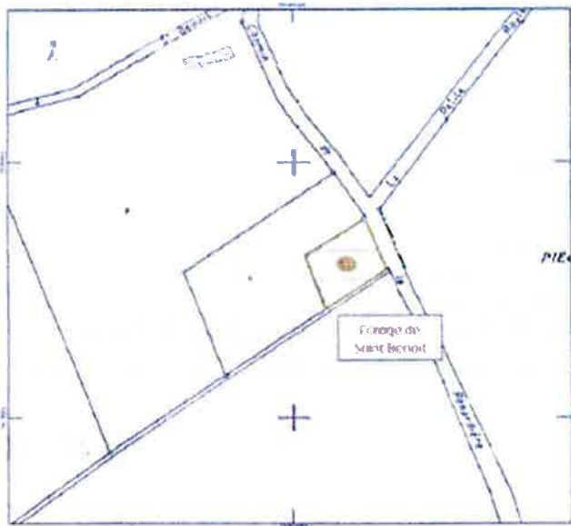
Plan du PPR avec la zone A1 (zone avec interdiction de point d'abreuvement)